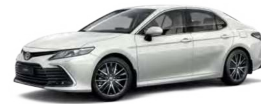
070 Белый перламутр