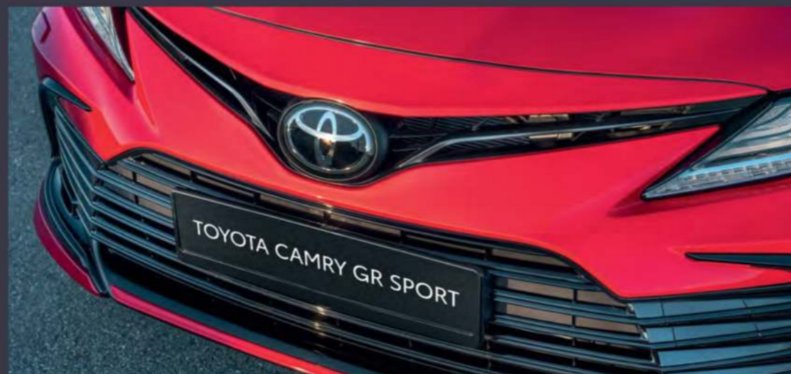
Черная решетка радиатора