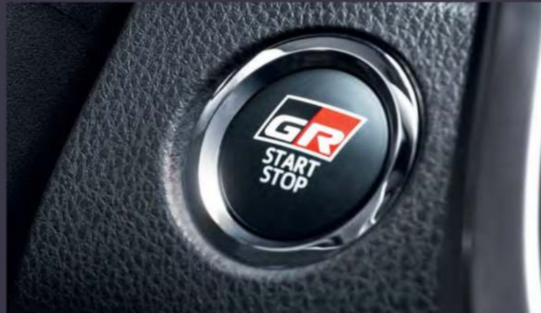
Кнопка запуска двигателя с логотипом специальной серии

Красные акценты в интерьере подчеркивают темперамент специальной серии и органично сочетаются с уникальной черной кожаной обивкой сидений. Эксклюзивный дизайн вставок элементов салона и логотип специальной серии завершают дерзкий образ Toyota Camry GR SPORT *.