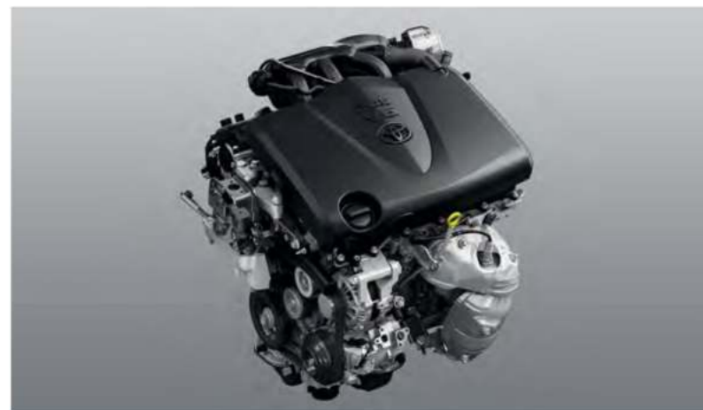
Атмосферный двигатель V6 3,5 л