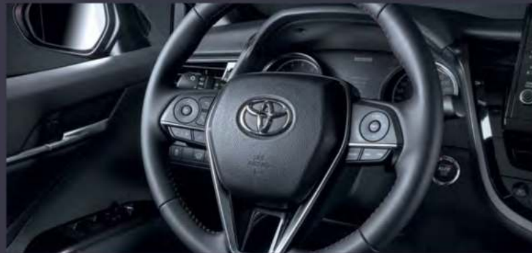
Красная прострочка на руле