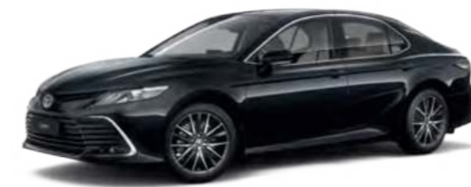
218 Черный металлик