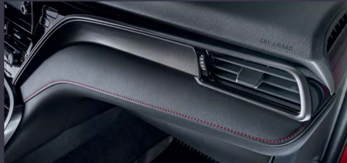
Красные акценты в интерьере