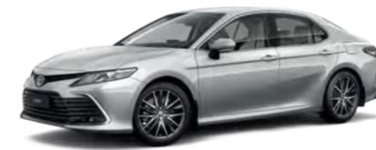
1F7 Серебристый металлик