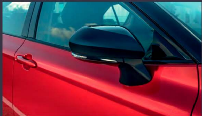
Черные корпуса зеркал заднего вида

Двухцветная окраска кузова, черные элементы экстерьера, смелые красные акценты на бамперах добавляют автомобилю еще больше динамики и подчеркивают характер победителя. Дополняют дерзкий образ Toyota Camry GR SPORT * полностью черные 18-дюймовые легкосплавные колесные диски и логотип GR SPORT на элементах автомобиля — отличительный знак спец. серии.