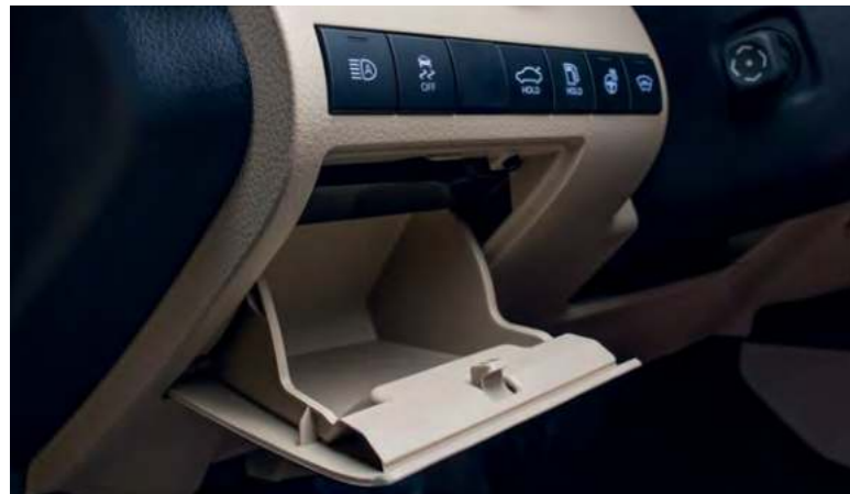
Место для хранения очков

Интерьер обновленной Toyota Camry отличает не только премиальный уровень комфорта, но и особое внимание к каждой детали. Новые декоративные вставки сдержанных тонов создают особую расслабляющую атмосферу в салоне бизнес-седана, а большое количество удобно расположенных мест для хранения помогут с комфортом разместить любые важные мелочи, которые всегда будут у вас под рукой.