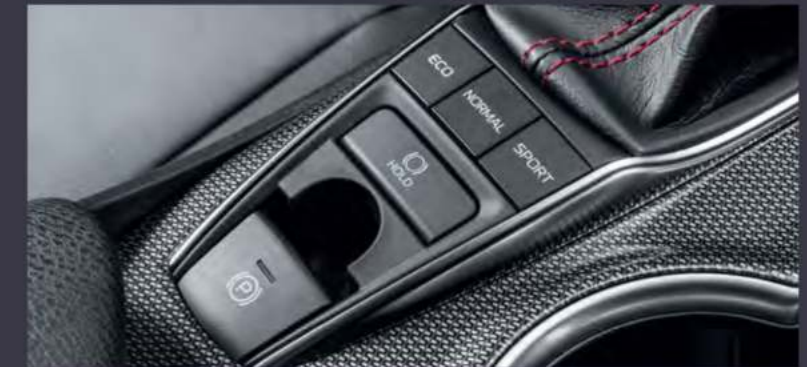
Кнопки выбора режима