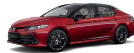
2QL Красный специальный металлик, с крышей черного цвета