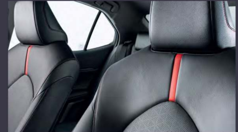
Черные кожаные сиденья с красной прострочкой и специальными вставками