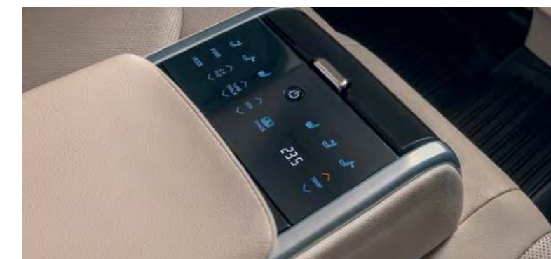
Сенсорная панель управления