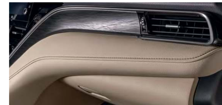
Кожаная обивка центральной консоли со стороны пассажира