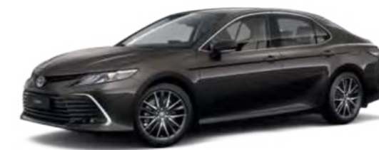
4X7 Серо-коричневый металлик