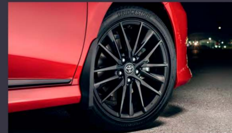
Черные колесные диски