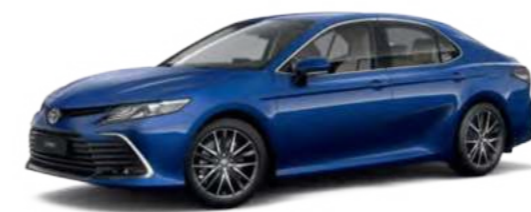
8W7 Синий металлик