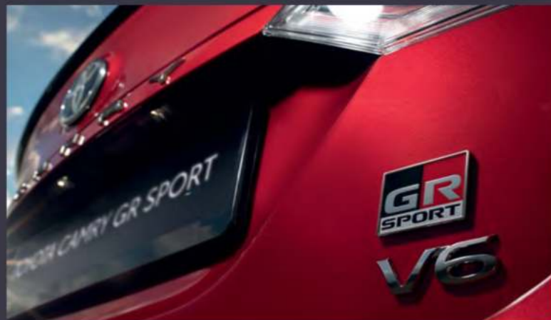
Логотип специальной серии

Для тех, кто стремится громко заявить о себе, Toyota предоставляет специальную серию Camry GR SPORT* в новом смелом красном цвете. Уникальное двухцветное исполнение кузова, исключительный дизайн интерьера, мощный двигатель и полностью светодиодная оптика — все это придает сдержанному бизнес-седану яркости и страсти как внутри, так и снаружи.