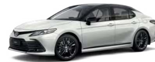
2P5 Белый перламутр, с крышей черного цвета

С более подробной информацией о всех дополнительных опциях и аксессуарах Toyota Camry вы можете ознакомиться в брошюре «Toyota Camry. Аксессуары».