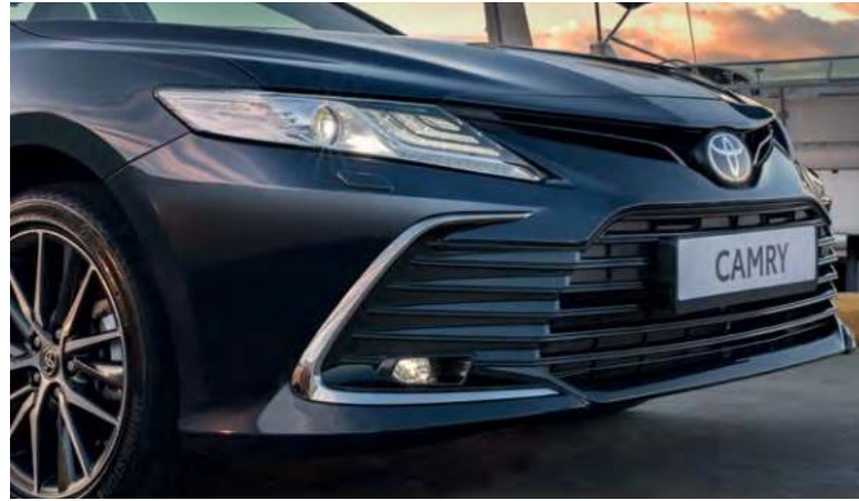
Массивная решетка радиатора

Обновленную Toyota Camry отличает стильный дизайн с динамичными линиями кузова. Дизайн, который узнаваем даже издалека! Обновленная, более выразительная форма переднего бампера, решетка радиатора с боковой хромированной окантовкой, новый дизайн дисков, увеличенные колесные арки — все это подчеркивает выразительный стиль легендарного бизнес-седана.