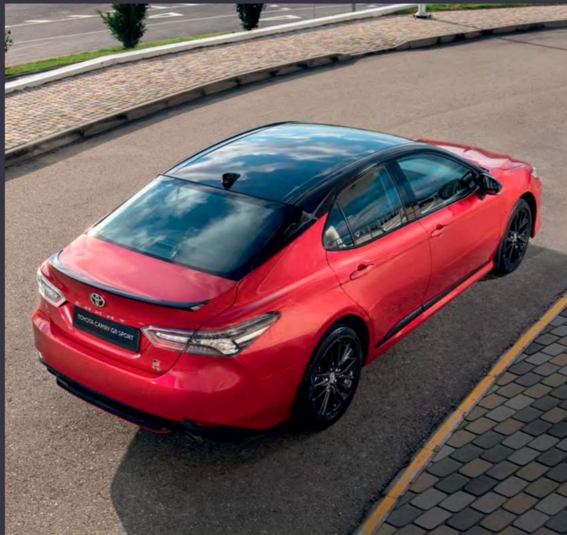
Двухцветная окраска кузова