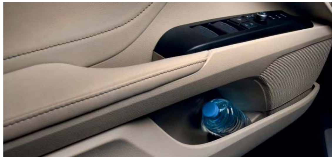
Держатели для бутылок в двери