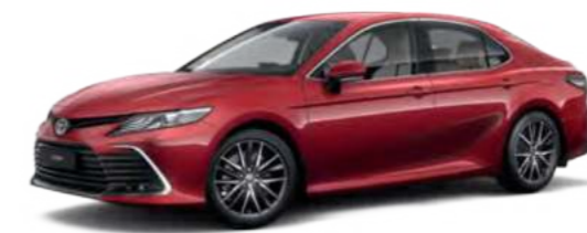
3R3 Красный специальный металлик