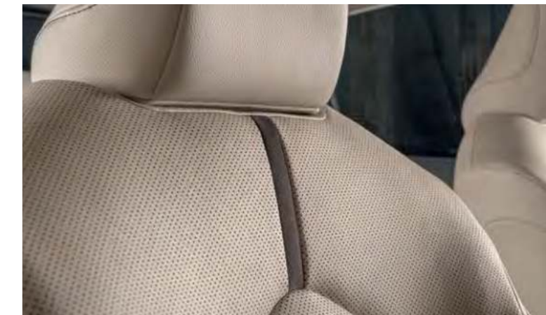
Обновленный рисунок перфорации сидений

Благодаря модульной архитектуре TNGA* в салоне обновленной Toyota Camry много пространства для ног и над головой, что поможет с еще большим комфортом разместиться водителю и пассажирам. Удобная высота сидений, комфортная посадка, вентиляция передних сидений, электрорегулировка положения сидений с функцией памяти — все это позволит вам раствориться в комфорте и наслаждаться каждой минутой своего пути. Обновленный рисунок перфорации сидений Toyota Camry и новые вставки выглядят еще более впечатляюще и при этом гармонично сочетаются с остальными элементами декора.