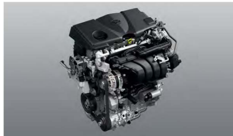
Двигатель 2 л

Обновленная 8-ступенчатая автоматическая коробка передач с двигателем 2,5 л обеспечивают более мягкое и быстрое переключение, демонстрируют впечатляющую динамику и что невероятно — экономию топлива! Больше нет преград стремительному движению навстречу самым амбициозным целям.