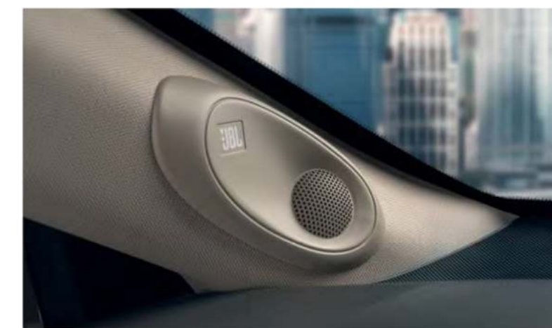
Аудиосистема JBL премиум-класса

Передовое оснащение сделает управление обновленной Toyota Camry незабываемым. Седан оснащен 7-дюймовым многофункциональным дисплеем на панели приборов, который обеспечивает более наглядное отображение всех данных. На лобовом стекле разместился цветной 10-дюймовый дисплей, куда проецируется информация с мультимедийной системы, важные сообщения, данные круиз-контроля и спидометра, благодаря чему прямо во время движения вы видите на уровне глаз всю необходимую информацию, не отвлекаясь от вождения. Обновленная Toyota Camry оснащена аудиосистемой JBL премиум-класса с 9 динамиками и технологией Clari-Fi™, которая позволяет восстанавливать качество звука и делать его максимально близким к оригинальной версии.