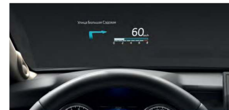
10-дюймовый цветной проекционный дисплей на лобовом стекле