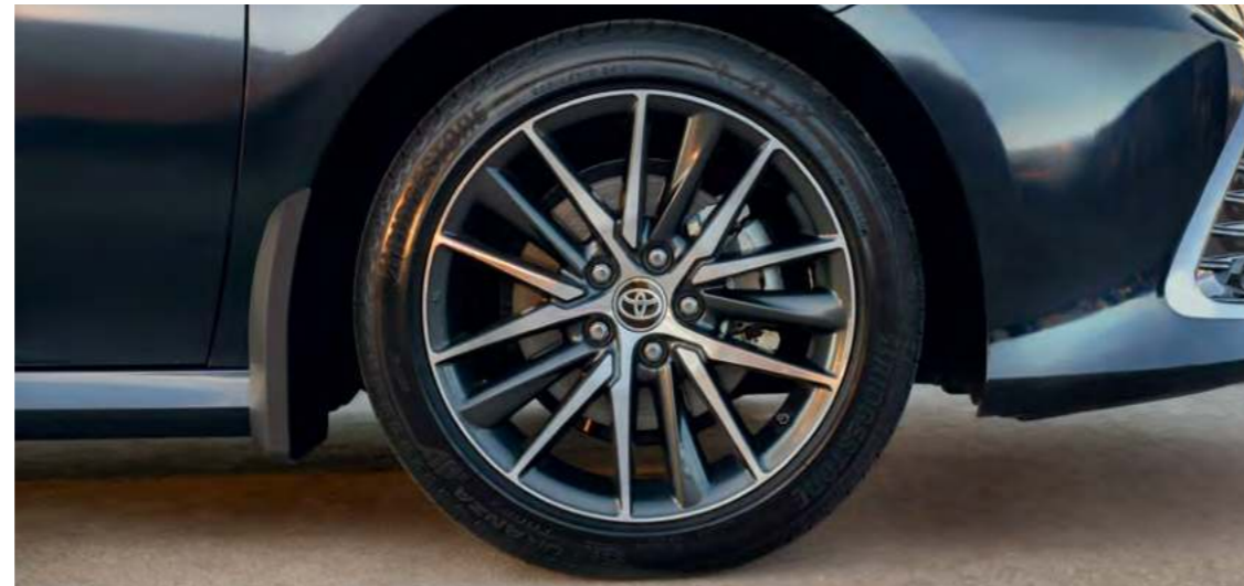
Новый дизайн дисков